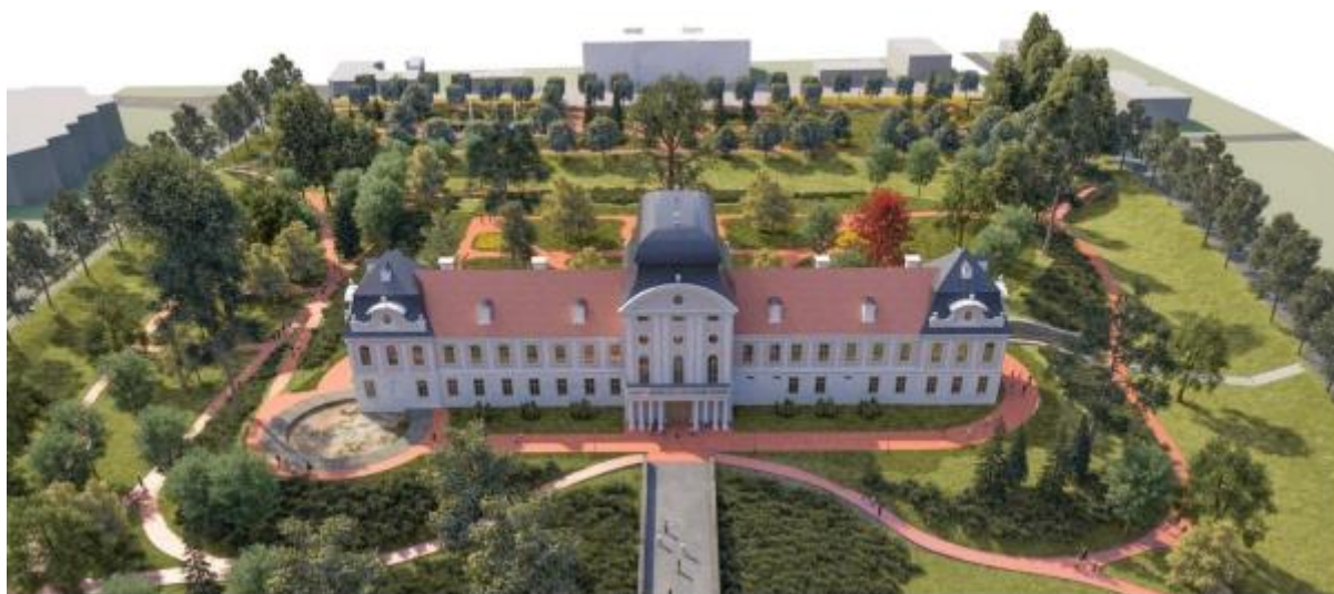
Slika 1.: Integrirani razvojni program Virovitice "5 do 12 za dvorac"